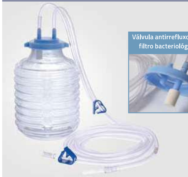
Válvula antirrefluxo com filtro bacteriológico